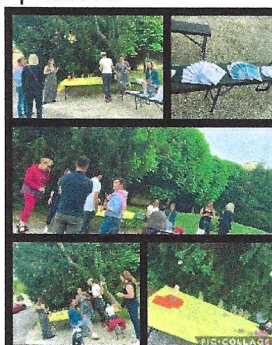
Cocktail dinatoire sur Epernay

et le choix des pansements par type de plaies à Château-Thierry )